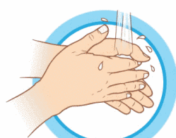
ЧАСТО МОЙТЕ РУКИ С МЫЛОМ